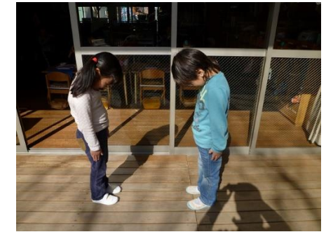
㊩ しぎだな あいさつすると きもちいい