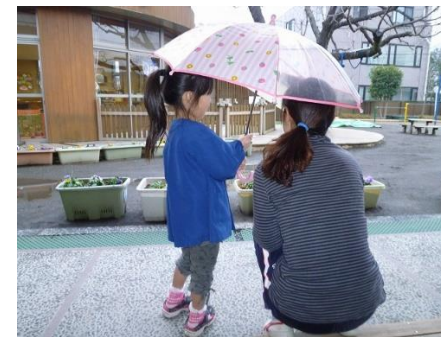
㊪ まはいる? こどものかさであいあいがさ