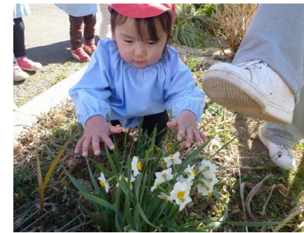
㊨ にさいた ちいさなはなをふまないで