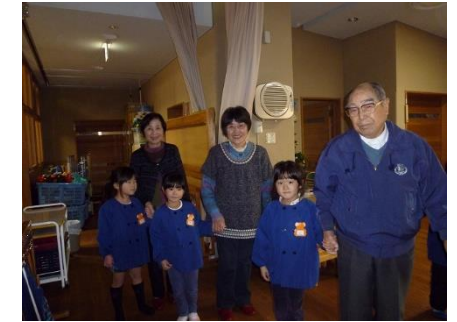
㊧ をつなぐ おじいちゃんおばあちゃんの つえがわり