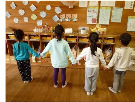
㊦ づけてこう やさしいきもちとおもいやり

※「思いやりカルタ」とは、平成25年度に思いやり活動の一環として、保護者の皆さんから、読み札の文句や思いやり写真を募集して、園で作成したオリジナルカルタです。思いやりカルタの一部を紹介します。