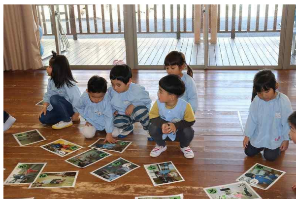
思いやりカルタ大会の様子